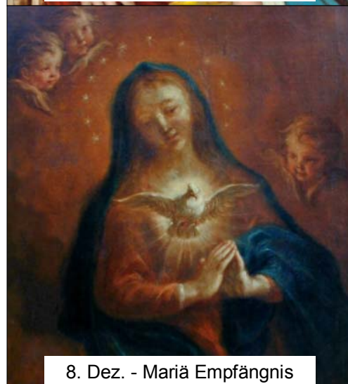
8. Dez. - Mariä Empfängnis