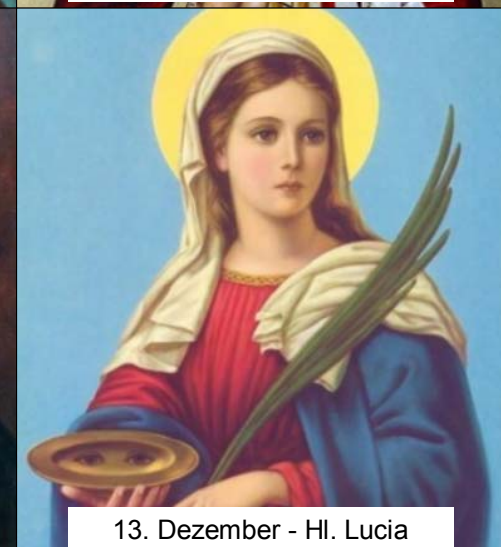
13. Dezember - Hl. Lucia