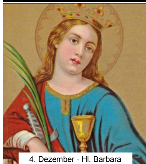
4. Dezember - Hl. Barbara